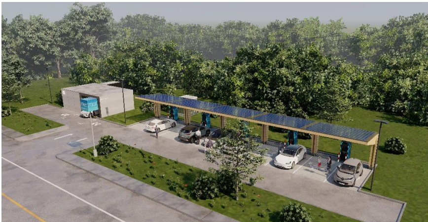
Mer und NIO – Eine Partnerschaft für die Zukunft der nachhaltigen Mobilität

Die angehängten Bilder stehen zur freien redaktionellen Verwendung. Eine druckfähige Auflösung der Bilder ist auf Anfrage verfügbar.